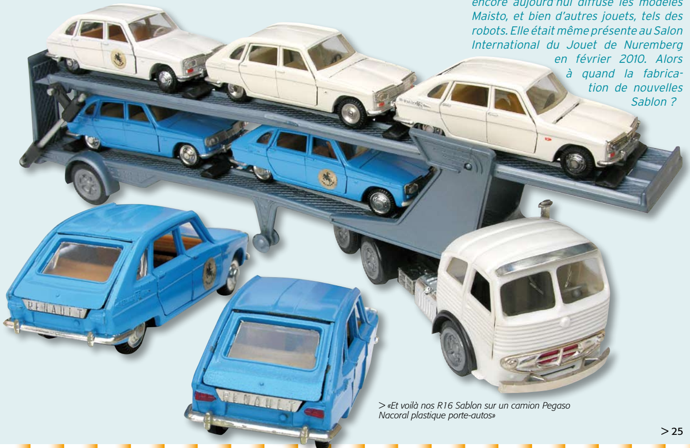
> «Et voilà nos R16 Sablón sur un camion Pegaso Nacorral plastique porte-autos»

PS : pour la petite histoire, il est intéressant de savoir que la firme Sablón existe toujours à la même adresse, qu'elle a distribué dans les années 1980 les miniatures hollandaises Best-Box et encore aujourd'hui diffuse les modèles Maisto, et bien d'autres jouets, tels des robots. Elle était même présente au Salon International du Jouet de Nuremberg en février 2010. Alors à quand la fabrication de nouvelles Sablón ?