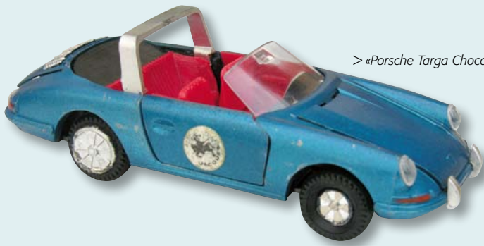
> «Porsche Targa Chocolat Jacques»