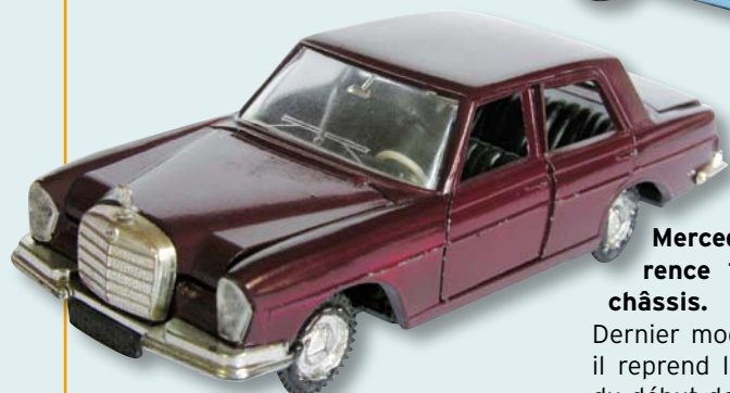
Mercedes-Benz 200 berline, référence 114, numérotée 10 sur le châssis.

Dernier modèle à figurer au catalogue, il reprend les caractéristiques de ceux du début de production avec les quatre portières ouvrantes possédant leurs entourages de vitres. Le volant en plastique blanc est différent des autres avec son cerclo-avertisseur typiquement Mercedes. Jamais reproduite