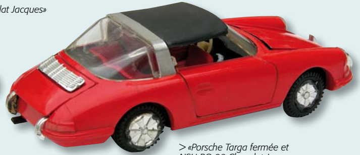
> «Porsche Targa fermée et NSU RO 80 Chocolat Jacques, mesurez les différences de jantes»

La marque Sablón demeure toujours confidentielle en France du fait de sa faible diffusion dans notre pays, et nous ne parlons pas des modèles Jacques qui étaient réservés aux consommateurs de ce chocolat belge qui existe toujours d'ailleurs. Quant aux Sablón-Diapet , à moins de s'être rendu au Japon, il y avait peu de chance de s'en procurer au moment de leur diffusion, ce qui n'est plus le cas à l'heure actuelle avec Internet. La fonte des roues enlaidissant considérablement les miniatures, les a rendues peu attrayantes, conduisant même à une impression de reproduction imparfaite et bâclée. En fait, il n'en est rien, et lorsqu'on prend la peine de remplacer les roues par celles de Solido ou Dinky Toys (ce qui va faire hurler les puristes) et cela quand on n'a pas la chance de posséder les dernières versions commercialisées, on est surpris par la «gueule» de ces autos. Bien sûr, on fait une entorse à l'authenticité, mais le jeu n'en vaut-il pas la chandelle ?