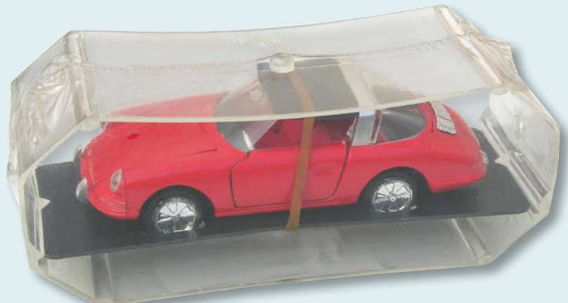
> «Boîte plastique en forme d'alvéole contenant une Porsche Targa fermée»

du point de vue esthétique et pratique. Bien plus tardivement et rarement donc, un boîtage en carton bleu foncé avec fenêtre transparente mentionne la marque Sablon-Yonesawa , made in Belgium.