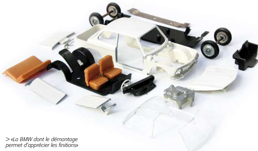
> «La BMW dont le démontage permet d'apprécier les finitions»