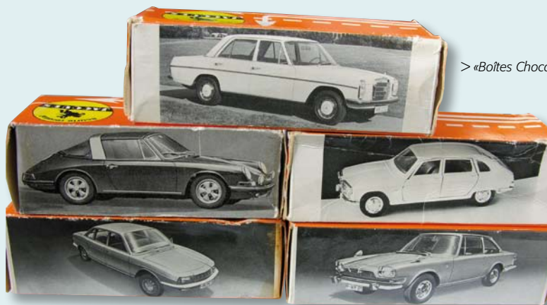
> «Boîtes Chocolat Jacques»

Dix voitures ont fait l'objet d'une reproduction. Elles ont toutes été créées selon un mode conceptuel semblable et original. La carrosserie en zamac est munie de portes et de capots ouvrants à la manière des Dinky Toys , Mebetoy s, Politoys , Edil-Toys , Tekno , Solido de la même époque. Le châssis en zamac est peint en noir, plus rarement en couleur, et reçoit, en relief les inscriptions «made in Belgium», le type du véhicule, et, soit la marque Sabløn avec un numéro de 1 à 10, soit, « SuperChocolat Jacques SuperChocolade » sans numéro, soit un pavé sans marque ni numéro japonais.