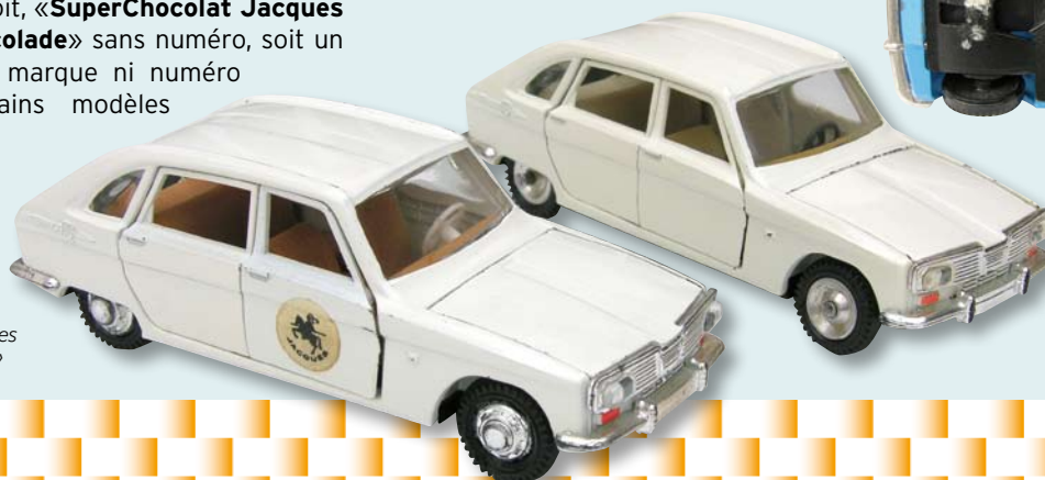
> «Renault 16 Chocolat Jacques et R 16 Sabløn»