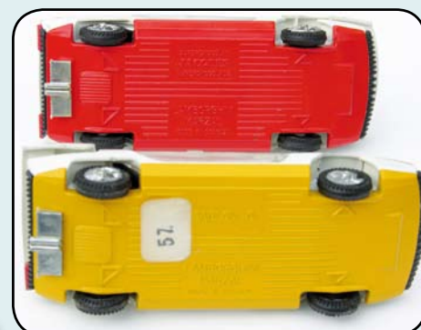
> «Appréciez les différences de châssis»

épaisse, tant à l'extérieur qu'à l'intérieur des ouvrants, ce qui ne sera plus le cas sur les dernières moutures (seulement l'extérieur y a droit : début du chant du cygne ?).