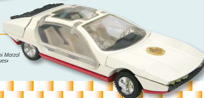
> «Lamborghini Marzal Chocolat Jacques»

La plupart des modèles de cette série ont été distribués par le chocolat Jacques avec une pastille ronde en papier autocollant représentant l'emblème de la marque, noir sur fond blanc, apposée sur la portière avant droite ou le capot. Tous les mois, à partir de septembre 1967, un nouveau spécimen était proposé : la Porsche Targa d'abord, puis la Mercedes en octobre, la Renault 16 en novembre, la BMW 2000 CS en décembre, la BMW 1600 en janvier 1968, etc... Quant aux camions Mercedes-Benz LP 2223, nous ne ferons que les citer, (ils feront l'objet d'une publication ultérieure), ne nous intéressant qu'aux automobiles pour le moment. La production des Sablons-Jacques-Diapet s'est étalée sur cinq ans et par la suite les moules ont été brièvement réutilisés par l'Espagnol Nacorral qui a employé de nouvelles teintes.