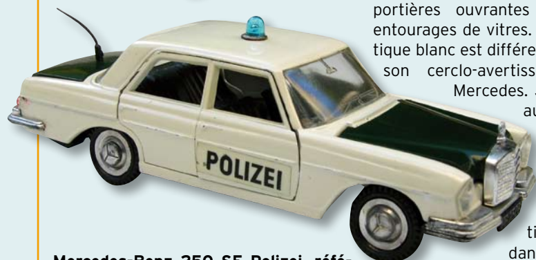
Mercedes-Benz 250 SE Polizei, référence 111, numérotée 2 sur le châssis.

Munie d'un gyrophare en plastique bleu sur le toit, elle est blanche avec capot et coffre vert kaki, et inscriptions «POLIZEI» en noir sur les portières. Une antenne noire est fixée sur le coffre.