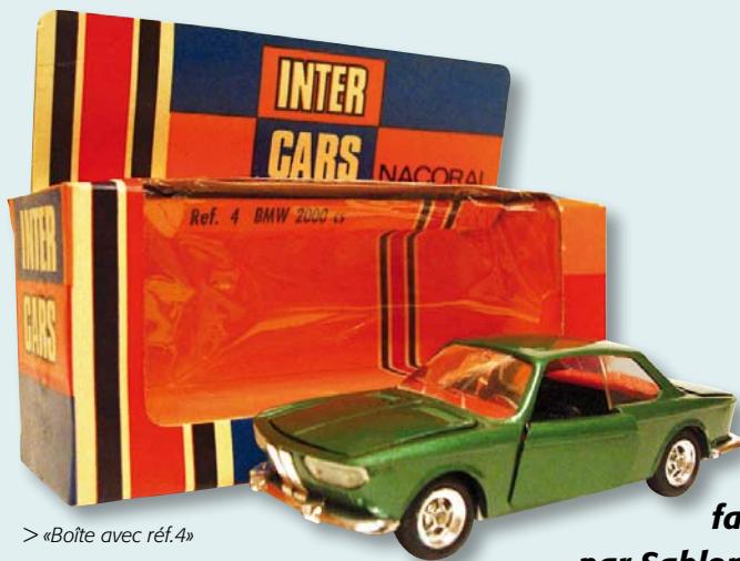
> «Boîte avec réf.4»